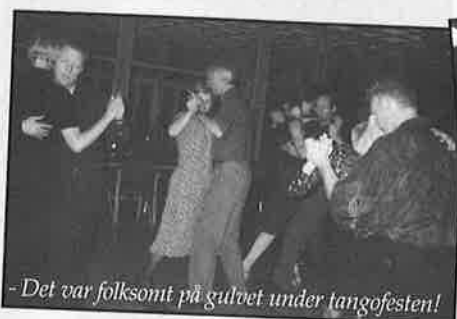
- Det var folksomt på gulvet under tangofesten!

Til høsten er hun igang igjen med Foss Tango torsdag, 20. August.