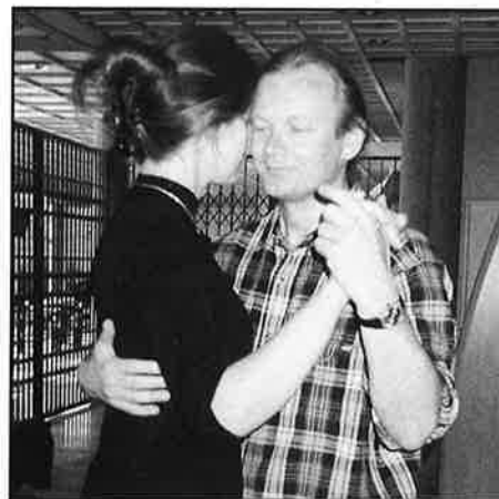
- Kurslederne var også glad i å danse!