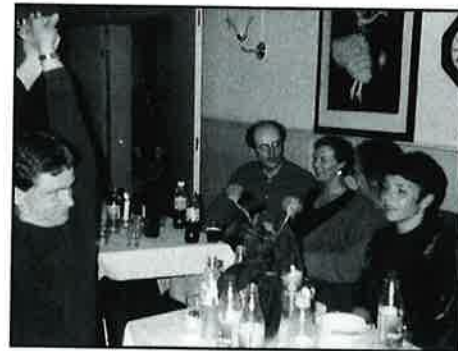
- Skal vi danse?

for røykeforbudet ble luften elendig. Det var godt over 200 mennesker der. For dere som kjenner storsalen på Bårdar vet dere at da måtte det være trangt om plass og luft.